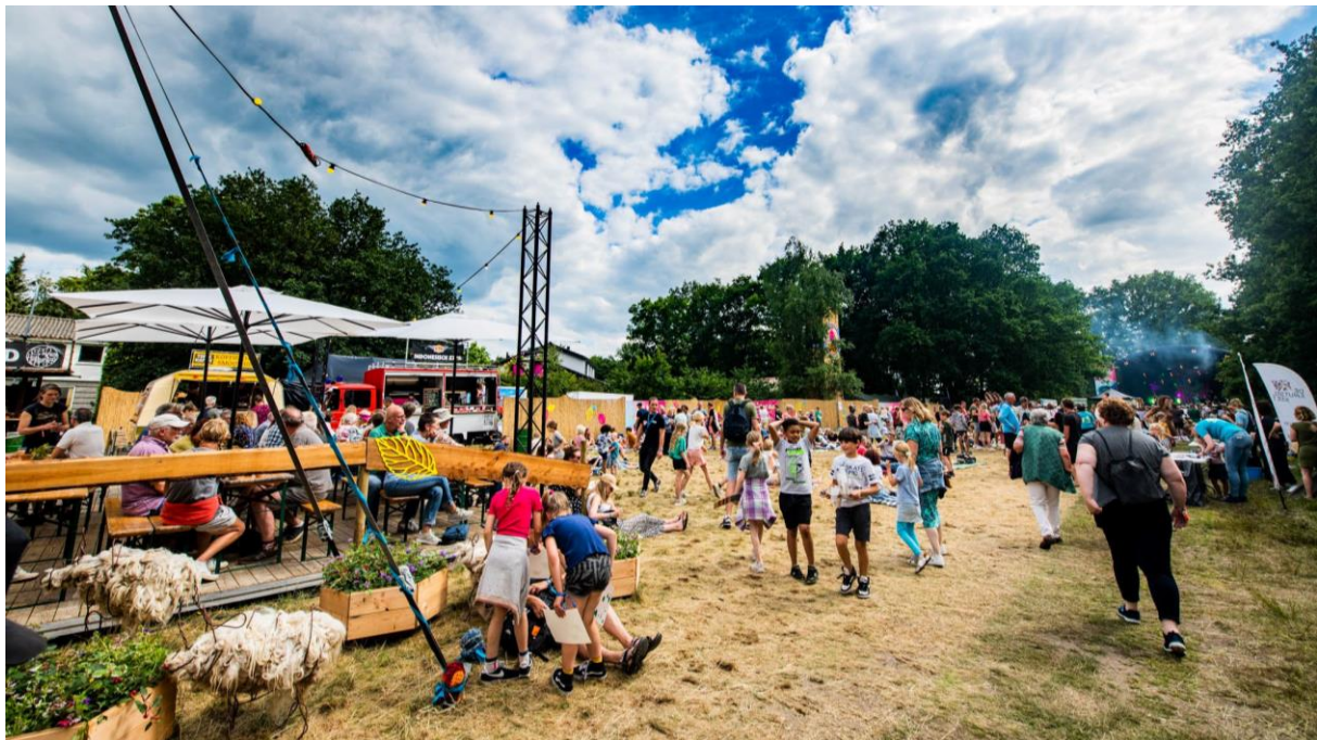
Sfeer festivalterreingezien vanuit de entree

Genieten van een vrolijk en eigenzinnig groen muziek- en theaterfestival in de Drentsche natuur.