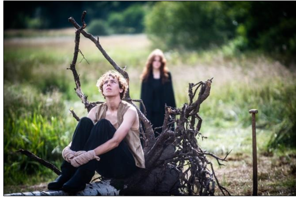
Beelden uit de voorstelling Roek van De Noorderlingen .

“ [Over Roek :] Een indrukwekkende zoektocht naar de eigenheid van het individu. ”