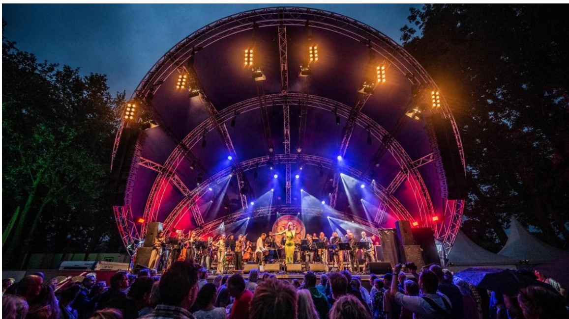
Het podium op de Brink in Zuidlaren donderdag 30 juni 2022