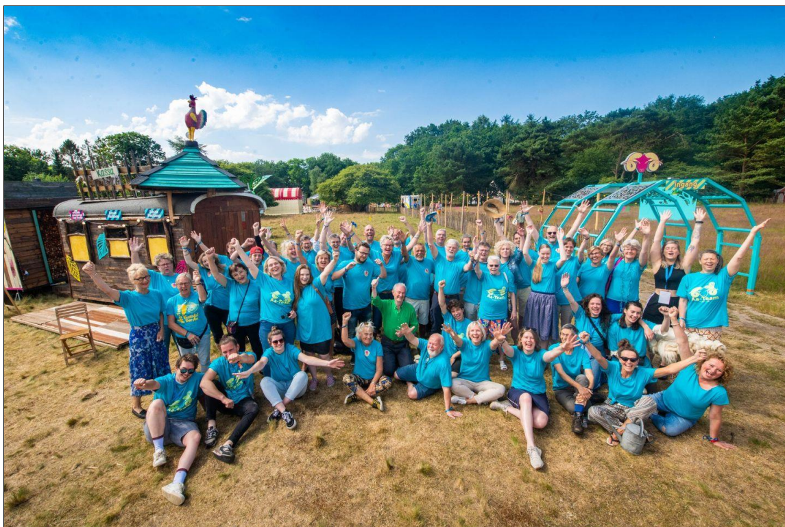
Een deel van de ongeveer 200 FestiValderAa 2022 vrijwilligers

“ Dank jullie wel voor de prachtige dagen en mooie muziek. Ik heb genoten . ” 🎵 🎸 🥁 🔥 🎭 🙏