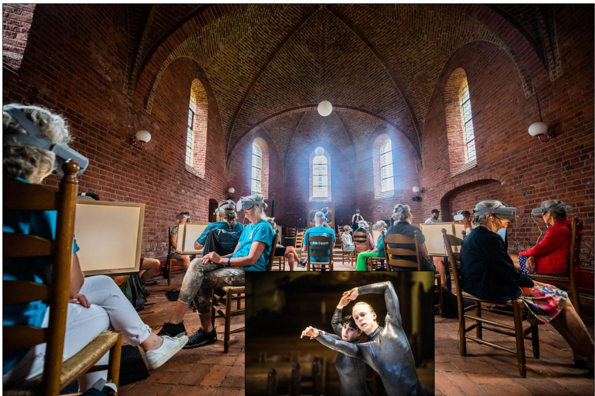
Het publiek onderging een virtual reality-ervaring in de dance performance Narcissus en Echo van House of Makers & Veejays.com (inzet).

Vernieuwend en grensverleggend was de interactieve virtual reality dance performance Narcissus en Echo van House of Makers & Veejays.com , over eenzaamheid en verbinding. Het publiek, met VR-bril, kon actief op zoek naar verborgen perspectieven en werd op die manier zowel toeschouwer als hoofdrolspeler. De ervaring is een samenspel van dans, storytelling, muziek en digital art. De vierde wand werd ook doorbroken in de tragikomische opera Rigoletto van DeSchoneCompagnie , een bewerking van de opera Rigoletto van Verdi en Le roi s’amuse van Victor Hugo, waarbij het publiek direct werd aangesproken, toegeschreeuwd en toegefluisterd.