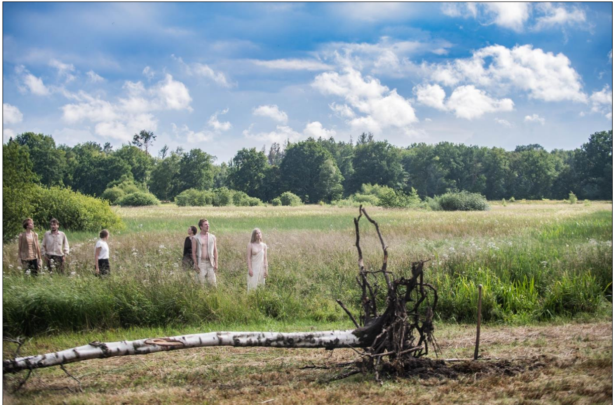
Beeld uit de voorstelling Roek van De Noorderlingen .